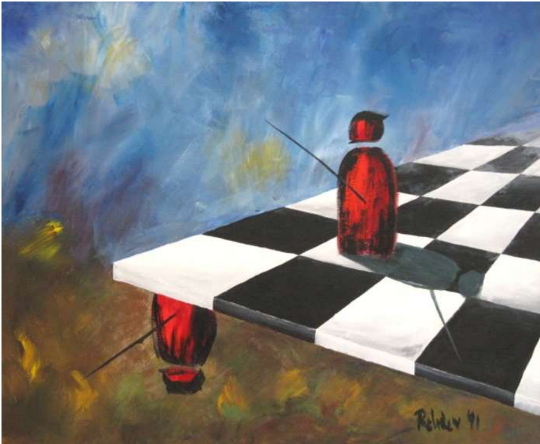
Ölbild: Elke Rehder